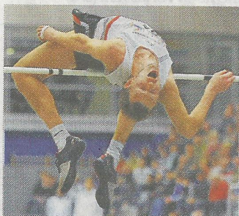
Der Russe Andrey Tereshin gewann 2006 und 2011 in Dresden.

■ Die Stars: Hochsprung Männer: Vorjahressieger Andrey Tereshin (Russland/Bestleistung 2,36 m), Afrikameister Kabelo Kgosiemang (Botswana/2,34 m), WM-Dritter 2009 Raul Spank (Dresdner SC/2,33 m). Stabhoch, Frauen: WM-Zweite Martina Strutz (Neubrandenburg/4,80 m), Anna Battke (Mainz/ 4,68 m), EM-Fünfte Jirina Ptacnikova (Tschechien/ 4,66 m). Abendkasse: ab 17.30 Uhr offen. Beginn: 19 Uhr web www.springermeeting-dresden.de